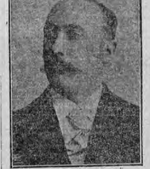
PROF. DON CARLOS GAGINI,

SEXTA: Conveniría, en consecuencia, la ejecución de textos nacionales, a reserva de que no se los declare exclusivos.