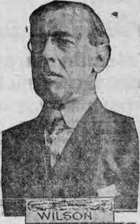
EL PRESIDENTE WILSON Cuyo discurso adjunto ha provocado viva discusión en el mundo europeo.

El señor Presidente después de discursar extensa y elocuentemente sobre la última frase dice: "No puede haber paz durable a menos que las naciones del mundo reconozcan y acepten el principio que los Gobiernos sólo derivan su poder del consentimiento del pueblo al que dirigen, y dentro de esa